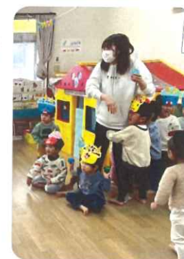
2月もたくさんあそんだね♪