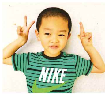
ゆきげんだいさん